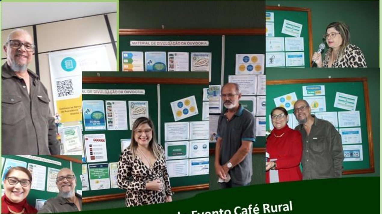
Organizadores do Evento Café Rural