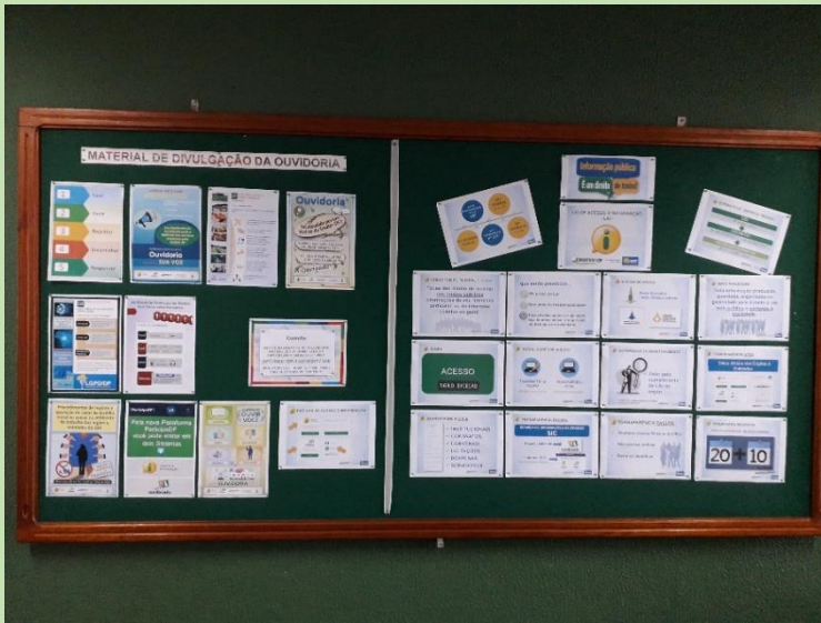
Quadro Mural Ouidoria e Acesso à Informação