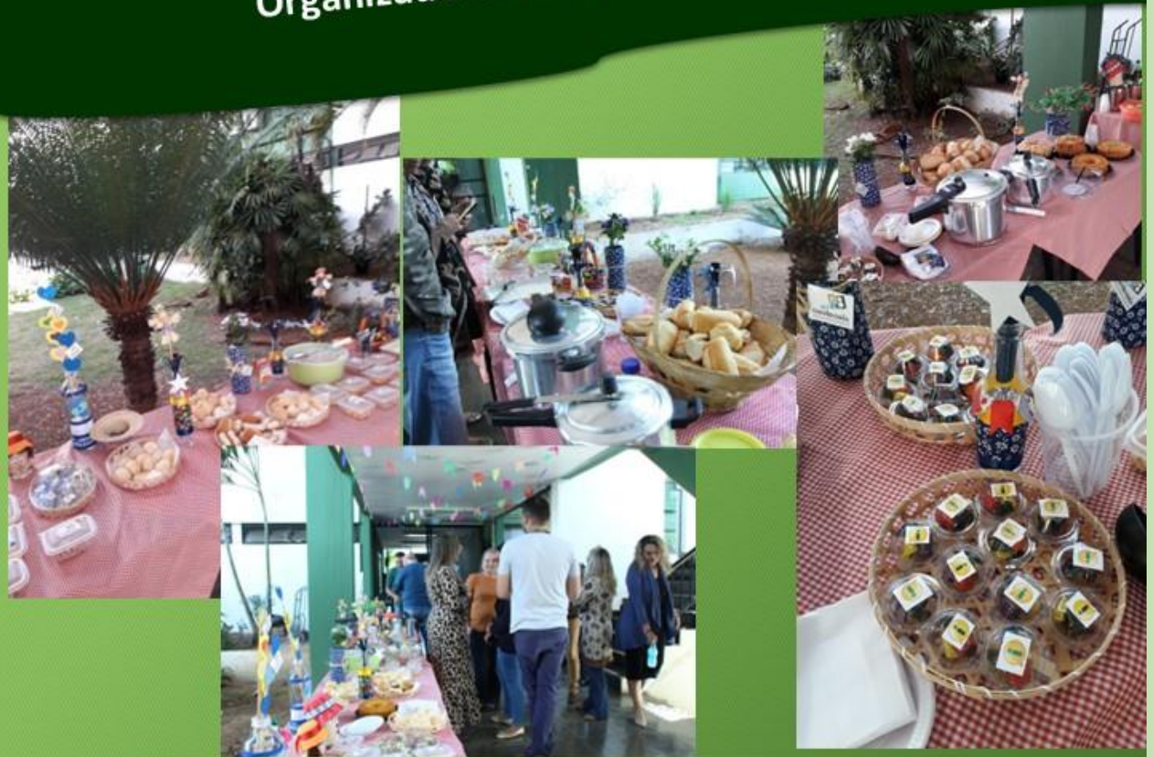
Delícias servidas no Café Rural